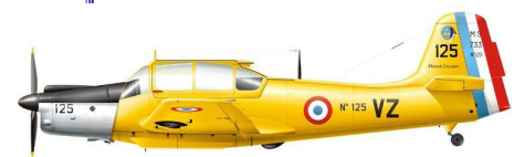
MS 733 Alcyon

A noter dans vos AGENDAS : la prochaine réunion de l'Association est programmée le :