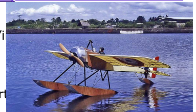
Le MS Type H 1913