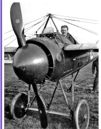
Morane-Saulnier Type N

Votre avis nous intéresse Asso.ms@socata.eads.net