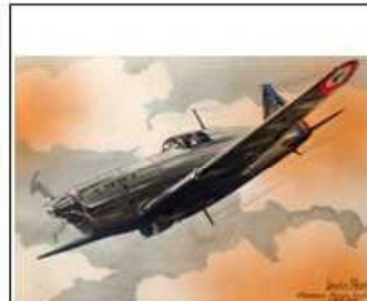
Carte postale MS 406 de Louis Petit