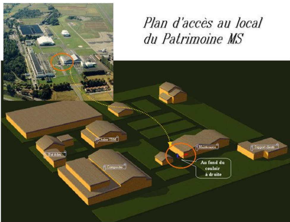
Plan d'accès au local du Patrimoine MS

Le local de l'Association : Comment vous y rendre ?