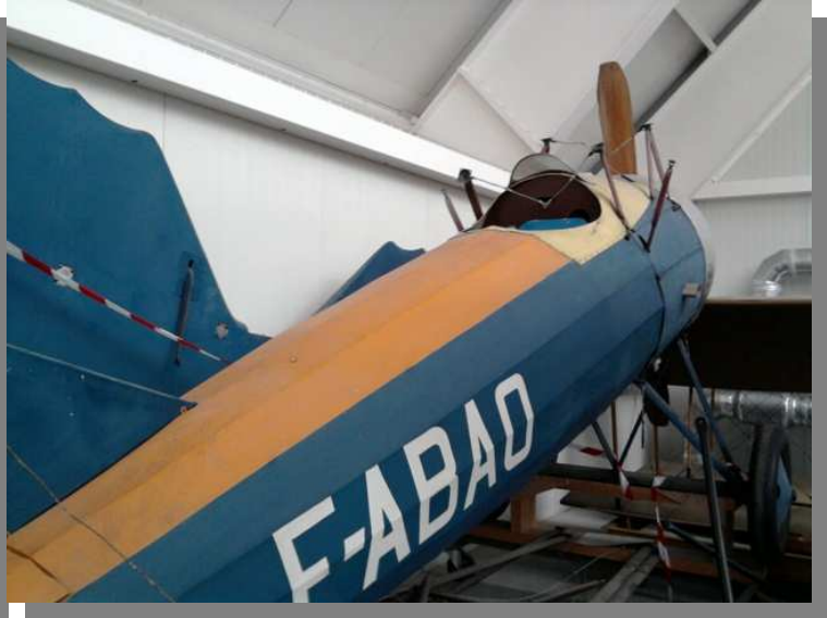
Morane Saulnier AI de Fronval