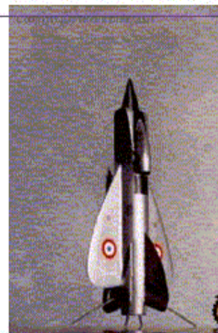
MoraneSaulnier Stratodyne 317 Projet des années 50