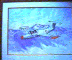
Aquarelle du MS760