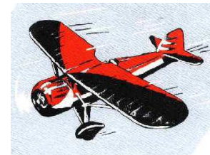
MS 230 aux couleurs de Michel DETROYAT

Le tir à travers l'hélice, Inventé en 1914 par Raymond SAULNIER, mis au point par Roland