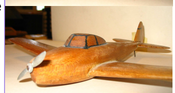
Maquette du MS600??