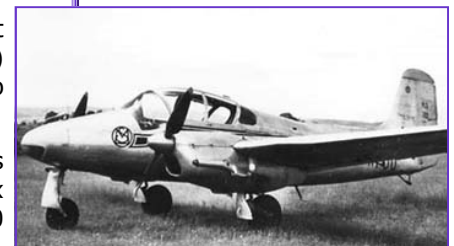
MS 700 Pétrel

Les membres de l'Association vous souhaitent à vous et vos familles une bonne santé, et un heureuse année 2009.